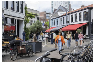
De trendy winkelstraat Kleine Berg is een goed bewaard geheim van Eindhoven.