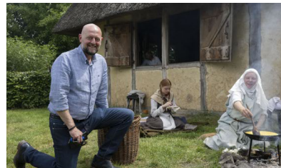
Het PreHistorisch dorp, een openluchtmuseum in de trend van Bokrijk.

Valks. De winkelnaam verwijst naar zijn studententijd in Antwerpen. "Ik heb er aan de academie architectuur gestudeerd", vertelt hij. "Vijf jaar heb ik er gewoond. Het is een topstad. De verleiding om er te blijven wonen, was groot. Toen ik er verbleef, vond ik Eindhoven maar een boerengat. In Antwerpen ben ik begonnen met fietsen te bouwen voor vrienden. Nu heb ik er een eigen zaak van gemaakt met een eigen merk. Ik koop oude fietsen op en maak er nieuwe exemplaren mee. Ze zijn volstrekt uniek en op maat van de klant gemaakt. Ik heb veel klanten uit Antwerpen. Grappig is wel dat een Antwerpenaar die