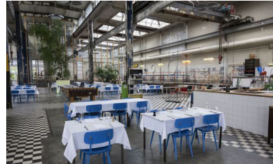
Radio Royal is in Strip-S een van de restaurants gevestigd in een oude fabriekshal van Philips.