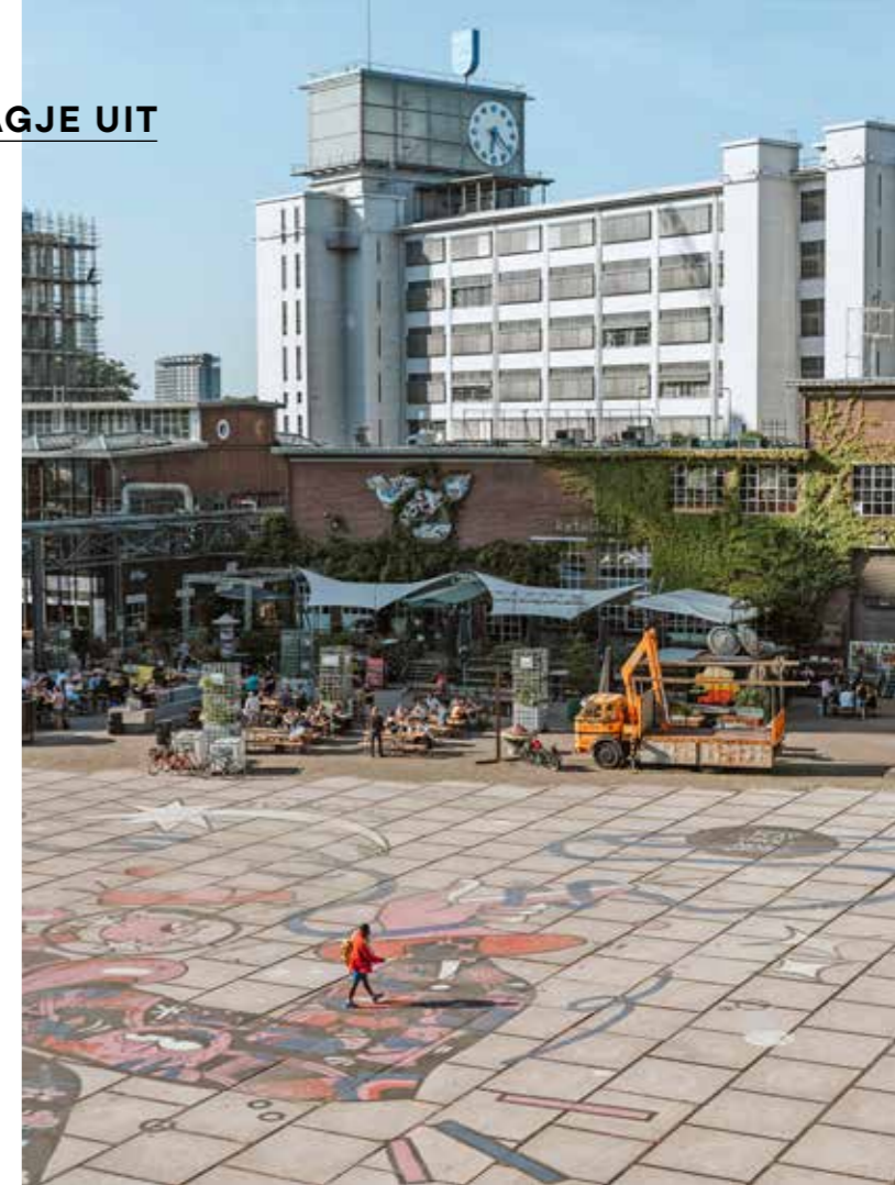
Met de klok mee Bovengrondse ventilatieschachten in Strijp-S, met verderop de oude schoorsteen aan de Philittelaan. / De Space Cowboy-vloerschilering op het Ketelhuisplein. / Het gezellige terras van Ketelhuis. Vorige pagina's Dit tijdelijke kunstwerk heet bezoekers welkom in Strijp-S.