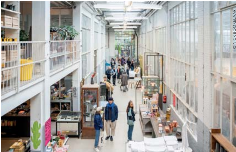
L'immense showroom du designer Piet Hein Eek, où se mêlent ses créations, ses marques de cœur, un hôtel, un espace gastronomique...