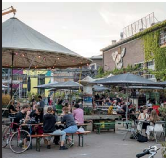
Au printemps, l'esprit convivial d'Eindhoven se vit aux terrasses des cafés.