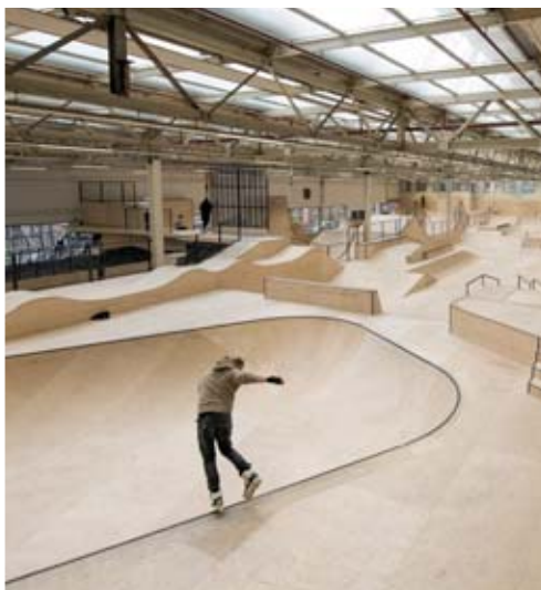
Skate Area 51, le temple de la cool attitude.