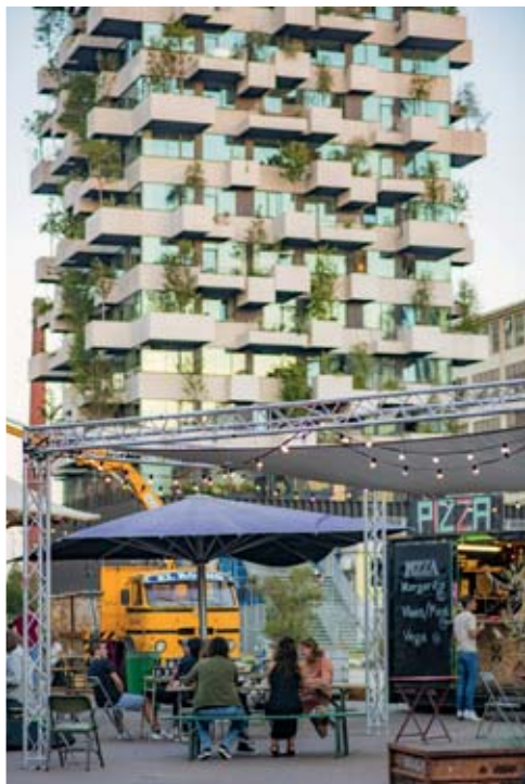
Terrasse au pied de la Trudo Tower, à Strijp-S, une œuvre architecturale végétalisée signée Stefano Boeri.