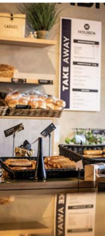
Houben et ses célèbres Worstenbroodjes .