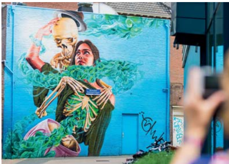
L'art urbain, symbole de la renaissance d'Eindhoven.