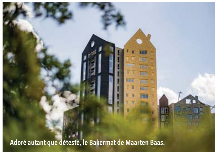
Adoré autant que détesté, le Bakermat de Maarten Baas.