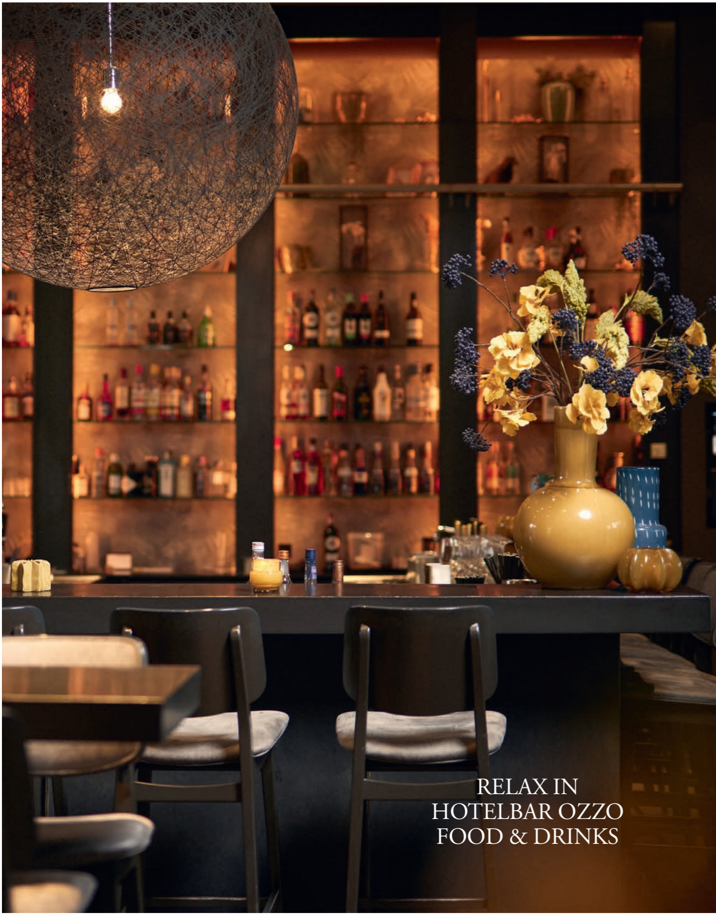
RELAX IN HOTELBAR OZZO FOOD & DRINKS