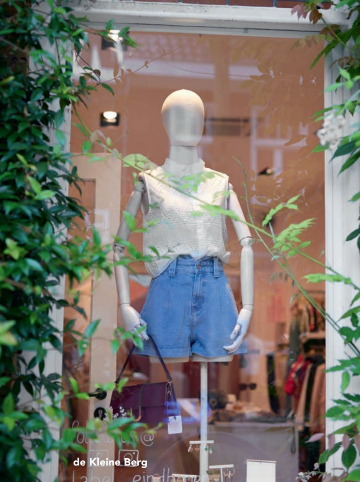
de Kleine Berg