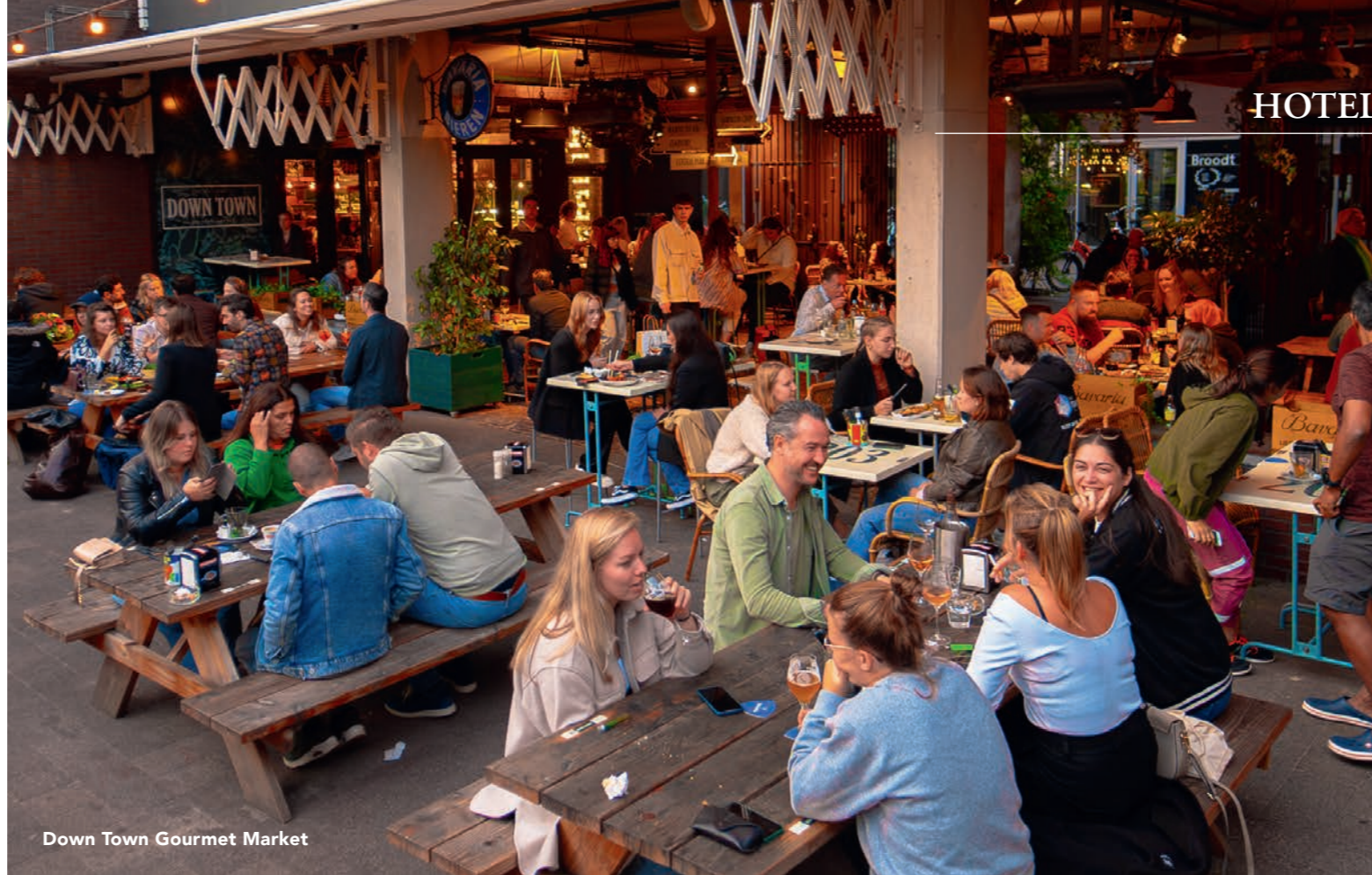
Down Town Gourmet Market